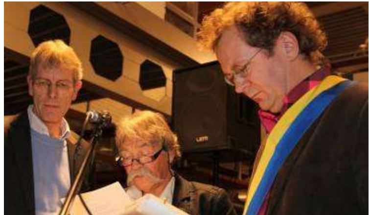
De drie stadsdichters aan het woord in hun gedicht "MINNEZANG"